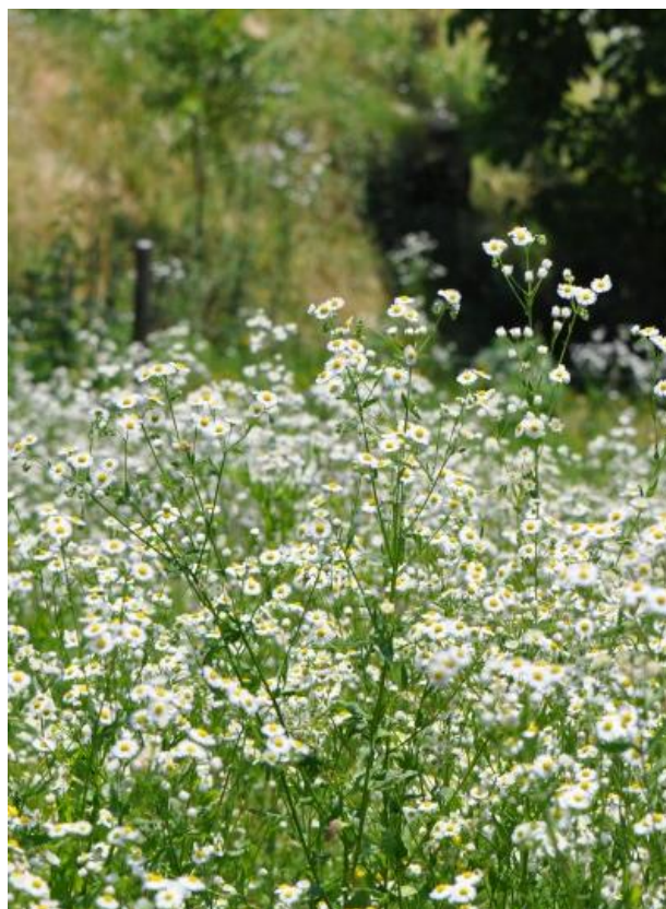
Erigeron annuus