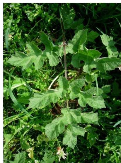
≠ Heracleum sphondylium Feuilles à divisions arrondies, divisées jusqu'à la nervure → semblent composées.