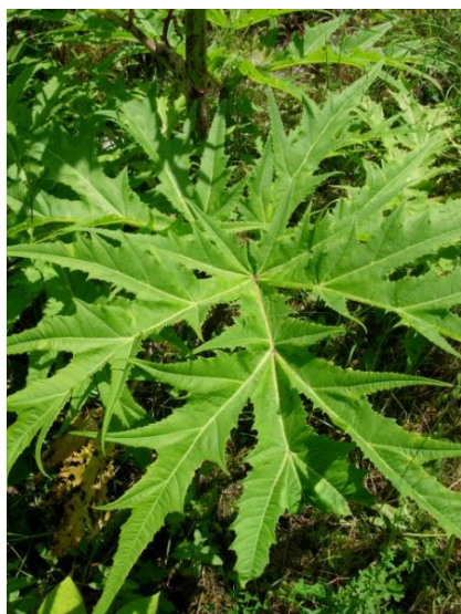
Heracleum mantegazzianum Feuilles à divisions dentées pointues, profondément divisées.