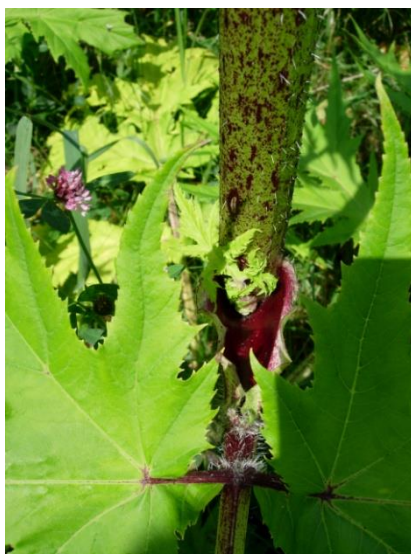
Tige ponctuée de taches rouges.