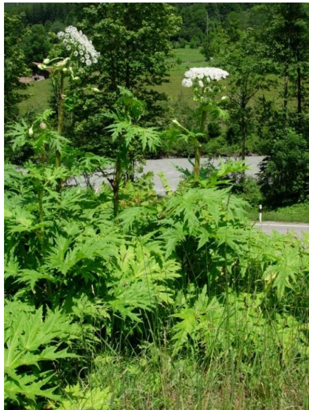
Heracleum mantegazzianum