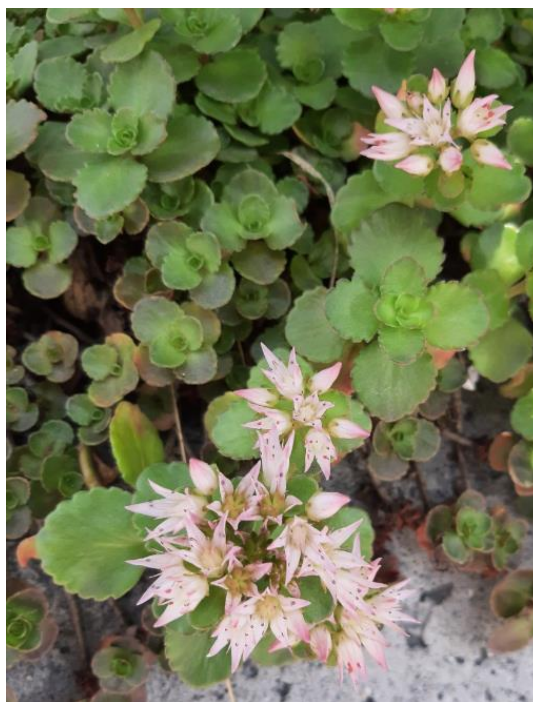
Sedum stoloniferum