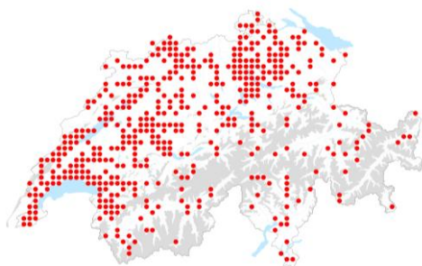
S. spurium : lien vers la carte de distribution InfoFlora

L'orpin bâtard et l'orpin stolonifère (bien connus sous les synonymes Phedimus spurius et P. stoloniferus ) ont été introduits comme plantes ornementales, particulièrement utilisés comme plantes couvrantes. En raison de leur croissance très vigoureuse et leurs stolons, ils s'échappent facilement des jardins et concurrence les espèces indigènes. Les deux espèces peuvent former des peuplements denses dans des prairies sèches et des zones rocheuses, milieux à haute valeur écologique, portant atteinte à la flore indigène locale. L'orpin stolonifère est de plus reconnu comme mauvaise herbe problématique dans les prairies extensives et intensives, portant atteinte à l'économie locale. La lutte contre les deux orpins exotiques est très difficile à appliquer en raison des fragments de tiges qui restent enraciner.